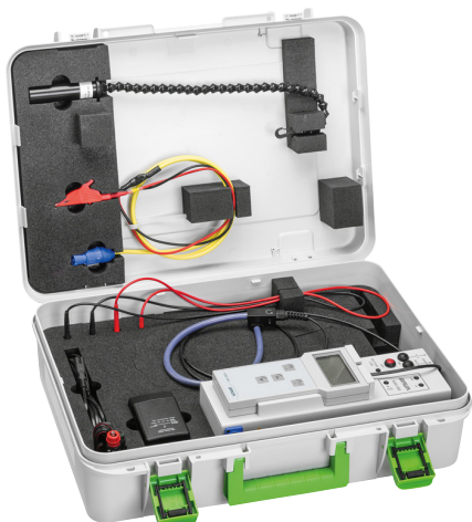
Рисунок: KSG 200 TA (с аккумулятором)