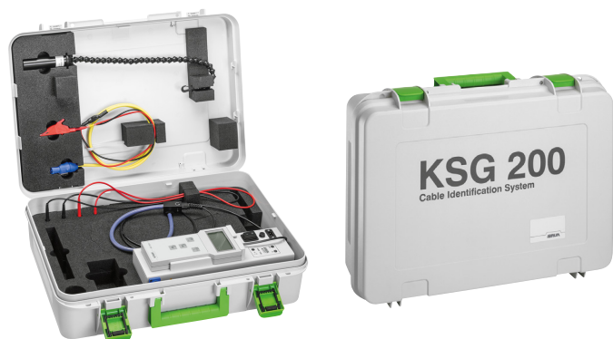
Рисунок: KSG 200 T (без аккумулятора)