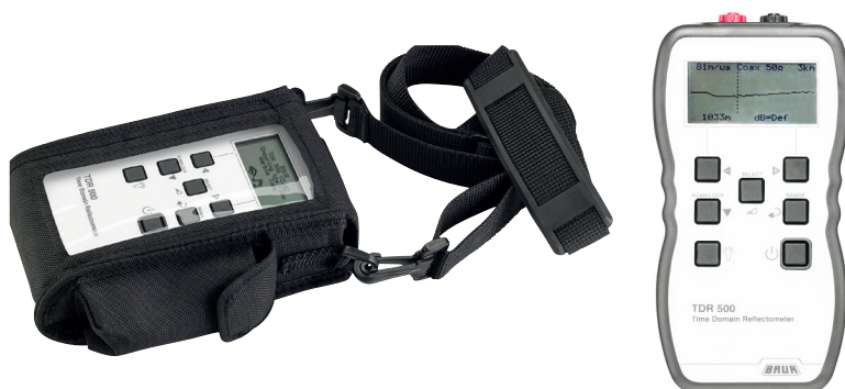
Пример: TDR 500